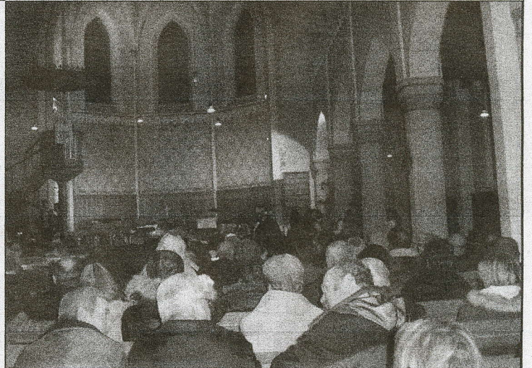
Auch von weiter hinten hatte man eine gute Sicht

Die Besucher würden sich bestimmt freuen, wieder ihre Gäste sein zu dürfen. Danke, ein schönes Weihnachten und bis zum nächsten Mal!